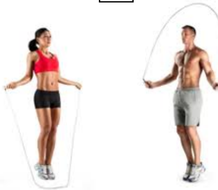
SALTAR LA CUERDA