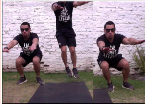
Sentadillas con salto lateral