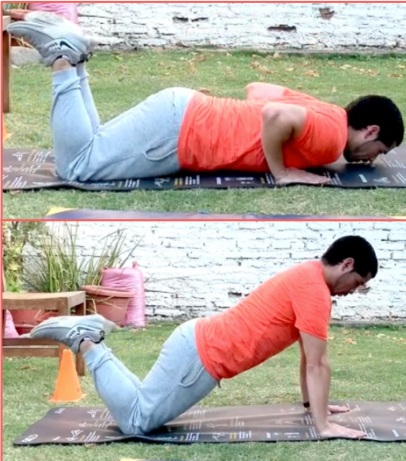
Flexiones de codo con apoyo de rodillas