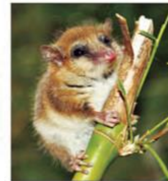
▲ Monito del monte

El monito del monte hiberna durante el invierno. Al llegar la primavera , comienza a reproducirse.