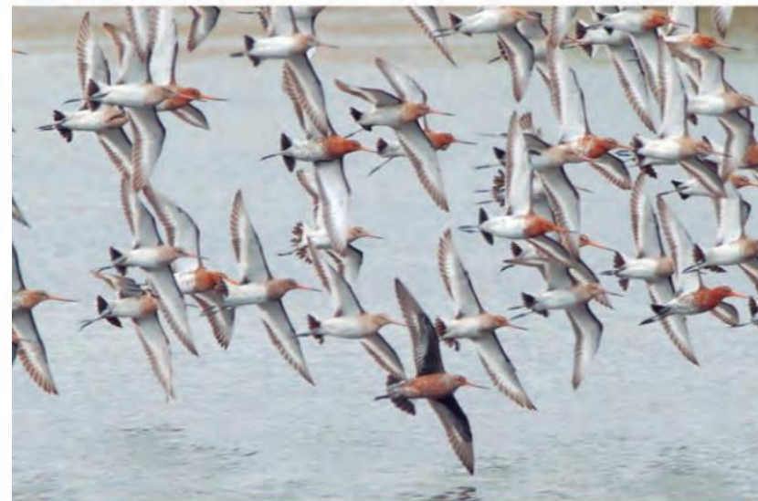
▼ Zarpito de pico recto

Cuando comienza el otoño, muchas aves migran hacia lugares donde es primavera . Por ejemplo, el zarapito de pico recto viaja desde América del Norte hasta el sur de Chile, donde permanece cerca de 5 meses.